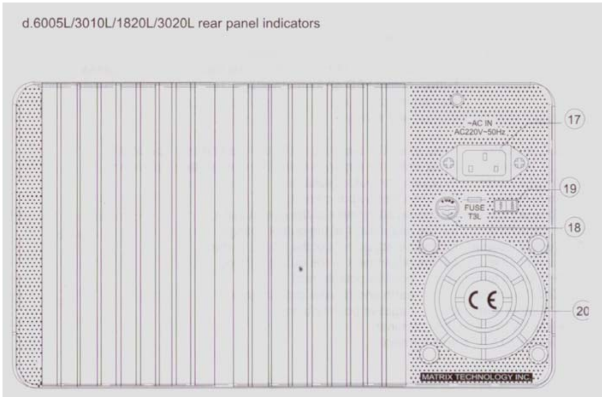
Fig 2) Vista panel posterior